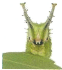
オオムラサキ 幼虫