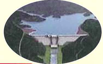
道の駅「おろちの里」